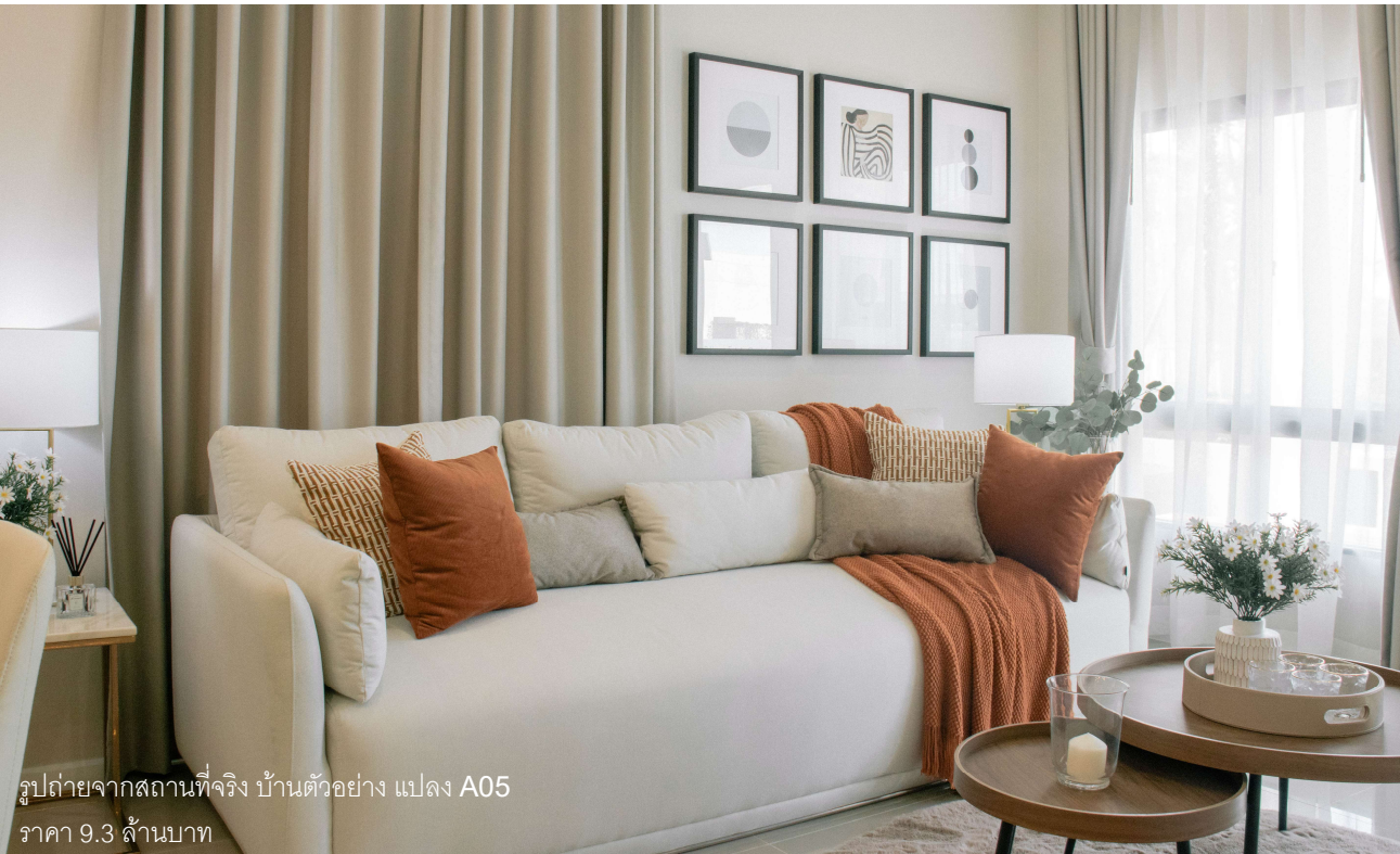
รูปถ่ายจากสถานที่จริง บ้านตัวอย่าง แปลง A05 ราคา 9.3 ล้านบาท